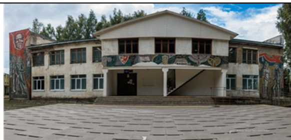
Шунгенский культурно-досуговый центр