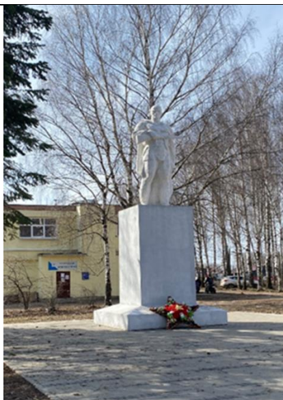
Памятник Погибшим воинам